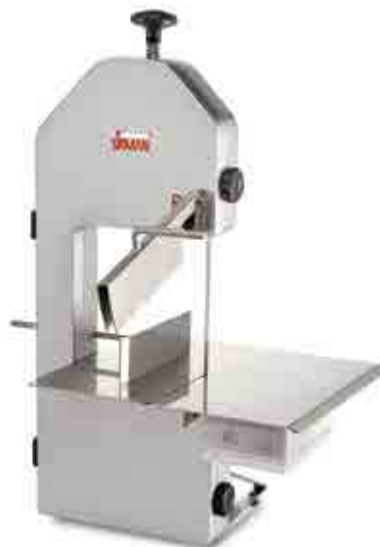
SO 1650 F3 / SO 1840 F3

该机为现代流线型设计，使用安全简便。用阳极氧化铝制成，明亮光洁，卫生防锈。非常简单准确，无论是调节高度还是调节横向距离都准确无误。