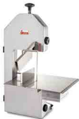
SO 1550 F3